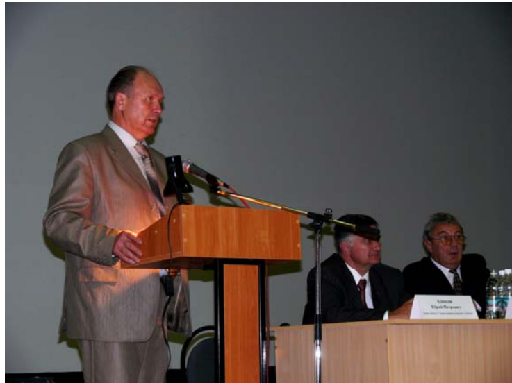
Выступление на межрегиональной научно-практической конференции. Пенза, 2010.