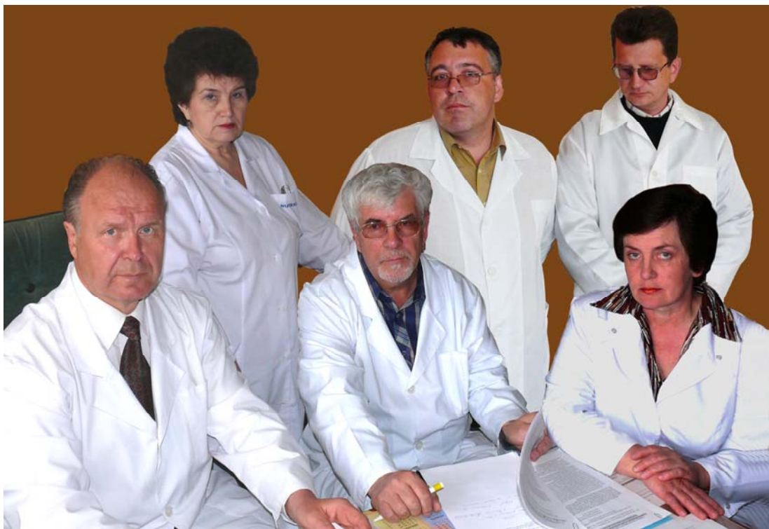
Преподаватели кафедры. 2010 г.