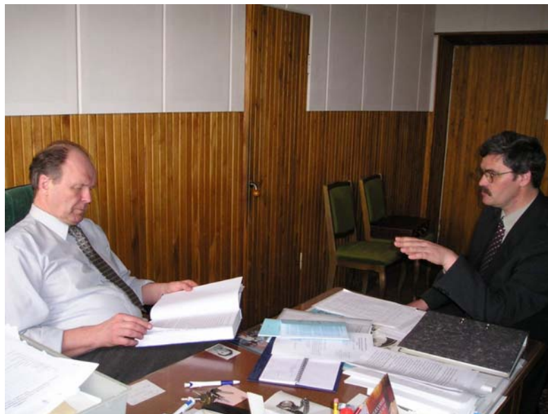
Обсуждение докторской диссертации.